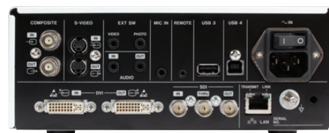
Panel Trasero 1411 PDF / ISD-051

Bahnstr.12, 65205 Wiesbaden-Erbenheim, Germany Phone : +49-(0)611-7158-0 Fax : +49-(0)611-7158-393 http://www.teac.eu Email: ipd-sales@teac.eu