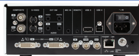
Panel Trasero 2109 PDF / ISD-062L