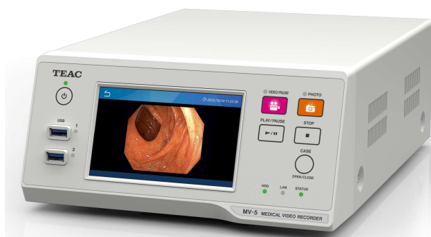
メディカルビデオレコーダー『MV-5』