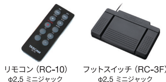
リモコン (RC-10) φ2.5 ミニジャック フットスイッチ (RC-3F) φ2.5 ミニジャック