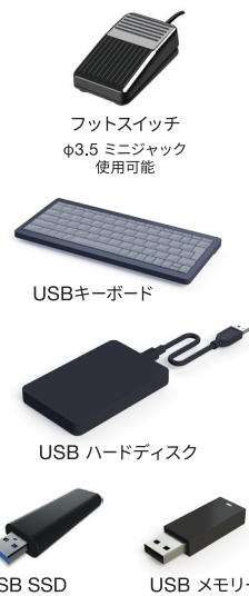
フットスイッチ φ3.5 ミニジャック 使用可能